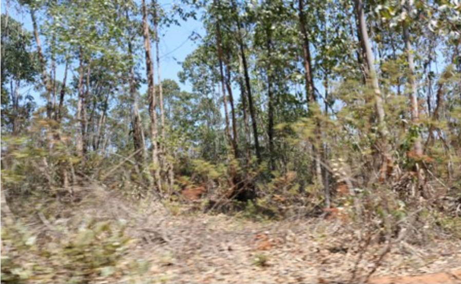
Imagem 01 – Grande incidência de eucalipto em reserva legal.

E por fim, esclarece-se que não fora proposta nenhuma metodologia de levantamento da densidade de espécies exóticas na informação complementar em questão, porque não cabe ao servidor da URA NM elaborar os estudos ou indicar metodologia, sendo inclusive impedido de demonstrar tal conduta.