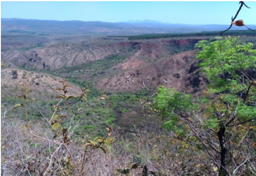
Imagem 04 – Vista de bordas de chapada existentes no empreendimento.

Diante das alegações colocadas pelo empreendedor no recurso aqui discutido e reproduzidas no item anterior, a equipe técnica da URA NM reitera o disposto no Despacho nº 93/2019/SEMAD/SUPRAM NORTE-DRRA.