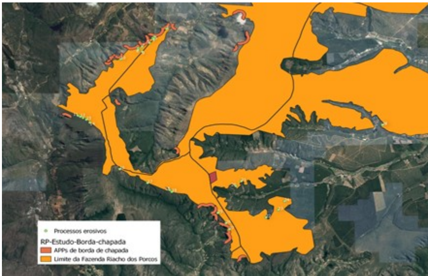
Imagem 03 – Processos erosivos (pontos verdes numerados), em sua maioria associados a estradas e áreas próximas as bordas de chapada.