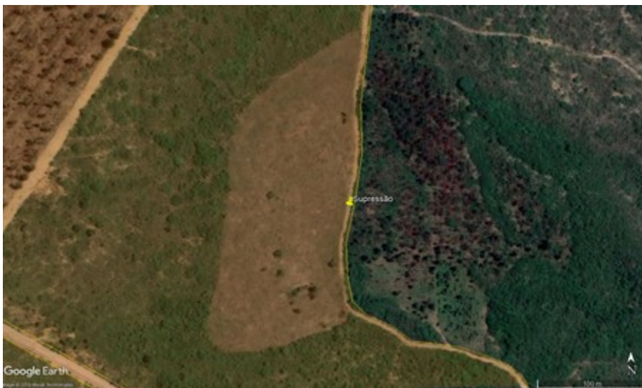
Imagem 05 – Área suprimida na Fazenda Vale das Embaúbas (2,48 ha).

Na oportunidade, o representante do empreendimento informou que o desmate teria ocorrido em razão de uma invasão da propriedade, e que havia sido feito um boletim de ocorrência sobre o fato. Assim, para esclarecimento do fato, foi solicitada a apresentação deste documento através de informação complementar, no entanto o boletim de ocorrência apresenta coordenadas de localização da área desmatada muito distante do local onde foi verificada a supressão, cerca de 13 km.