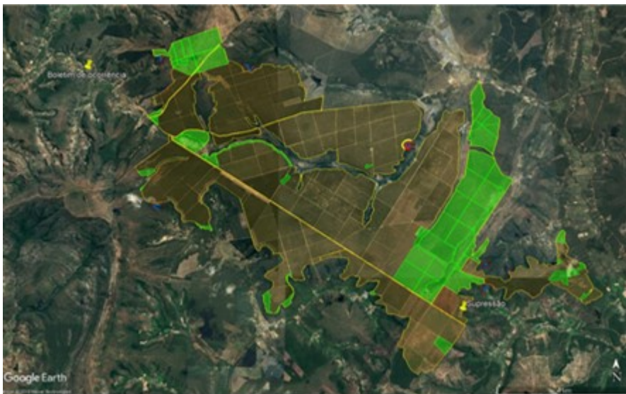
Imagem 06 – Visão geral da fazenda Vale das Embaúbas e distância entre a coordenada da supressão verificada em vistoria e a coordenada especificada no boletim de ocorrência número M7104-2018-00001232 de 05/09/2018 fornecido pelo empreendedor (13 km).

Na oportunidade, o representante do empreendimento informou que o desmate teria ocorrido em razão de uma invasão da propriedade, e que havia sido feito um boletim de ocorrência sobre o fato. Assim, para esclarecimento do fato, foi solicitada a apresentação deste documento através de informação complementar, no entanto o boletim de ocorrência apresenta coordenadas de localização da área desmatada muito distante do local onde foi verificada a supressão, cerca de 13 km.